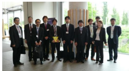
参加されていた診療放射線技師のみなさん

上記は、看護師やコメディカルに関するセッションを挙げました。これを見る限り、救急医療は、三位一体いや四位、五位といった連携を求めていることが分かります。我々放射線技師に対する期待も大きいと感じました。今後この認定機構を中心に救急医学会との連携を深め、我々の持っている最高の放射線技術を救急診療に提供することで、救急医学の発展に貢献できると感じました。